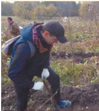
Чистая работа Железнодорожники присоединились к Всероссийскому экологическому субботнику.

В рамках акции, инициированной Общероссийским экологическим движением «Зелёная Россия», железнодорожники очистили 36 тыс. кв. метров городских территорий, более 485 тыс. кв. метров полосы отвода железной дороги, 828 тыс. кв. метров производственных территорий железнодорожных предприятий, собрали и передали на утилизацию специализированным организациям 258 тонн отходов, ликвидировали 97 несанкционированных свалок, а также высадили более тысячи саженцев. На этот раз к экодвижению присоединились свыше 13 тыс.